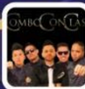
Combo Con Clase