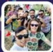
Tomo Como Rey