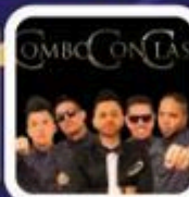
Combo Con Clase