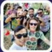
Tomo Como Rey