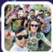
Tomo Como Rey