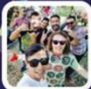
Tomo Como Rey